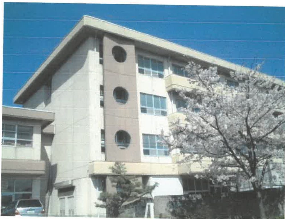
新神田校下拠点避難所：新神田小学校