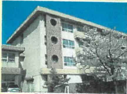
新神田校下地区避難所 新神田小学校